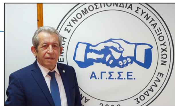
Του Α. Μπιρμπιλή Γεν. Γραμματέα ΑΓΣΣΕ

Το κωμικοτραγικό αυτού του αλαλούμ αυτών που χρω-