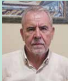
Άρθρο του Γιώργου Κουτσιμπογιώργου Προέδρου της ΑΓΣΣΕ*

Ε νόψει του Μίνι-Ασφαλιστικού και μετά τον πρόσφατο ανασχηματισμό, με την ανάληψη της νέας ηγεσίας στο υπουργείο Εργασίας, θέλουμε να απευθύνουμε τα παρακάτω 10 ερωτήματα στην υπουργό κυρία Νίκη Κεραμέως .